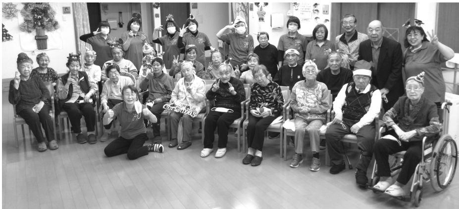
↑今年もクリスマス！みんなで迎えました！