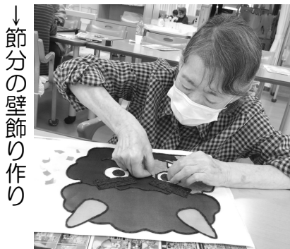
↓ 節分の壁飾り作り