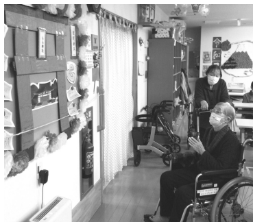
↑正月はらら神社でお参り