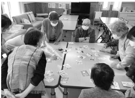
↑年始め 新得カルタ大会！