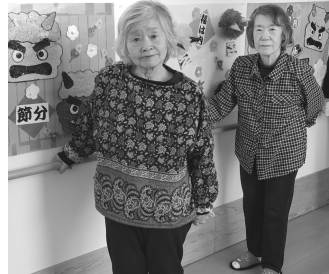
今年のきらりも 笑顔が溢れています